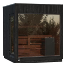
Kirami FinVision® -sauna M Misty (Left), Harvia Virta Combi 10,8 kW