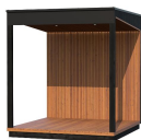
Kirami FinVision® -terrasse M Misty

N'oubliez pas de regarder nos accessoires.